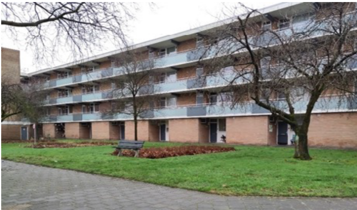
Figuur 1. Complex aan de buffelstraat

De besluitvorming rondom de aardgasvrij transitie voor de Buffelstraat is helemaal afgerond en de werkzaamheden voor het geplande onderhoud zijn van start gegaan kort na de aanvang van het onderzoek. Dit onderzoek richt zich dus op de bredere vraag om het proces waarlangs de draagvlakmeting tot stand is gekomen te evalueren, om inzichten en aanknopingspunten te bieden voor toekomstige aardgasvrijtrajecten.