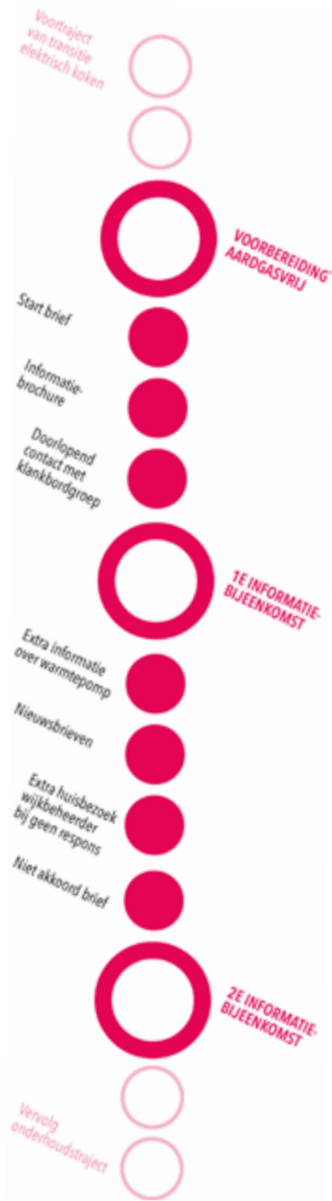
Figuur 2. Communicatietraject Talis - Project Buffelstraat Aardgasvrij 2023